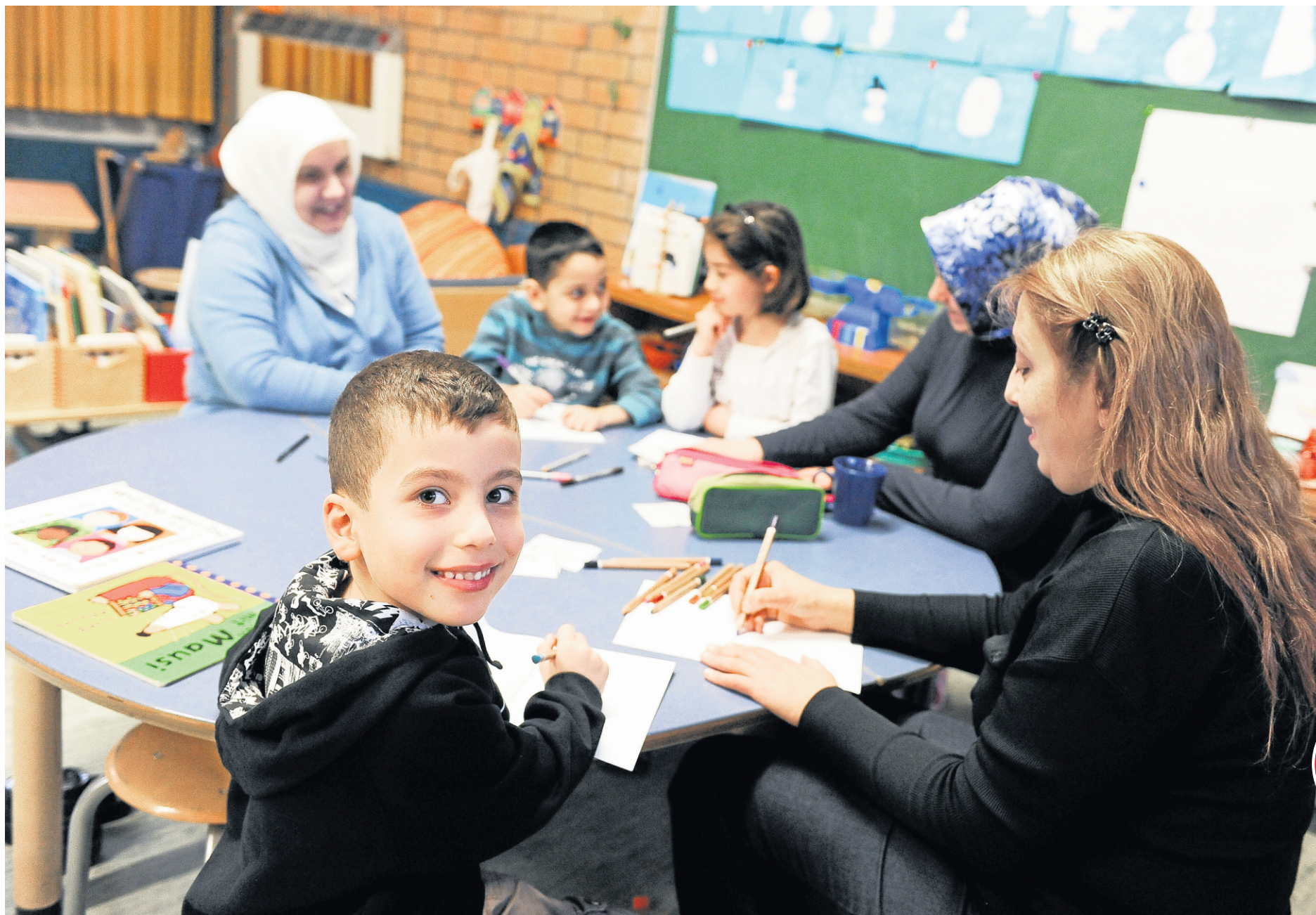
An der Georg-Kerschensteiner-Grundschule gehören die FLY-Angebote zum Schullalltag. Eltern und Kinder lernen und basteln gemeinsam. (Archiv) FOTO: BERTOLD FABRICIUS

Wir sind seit vielen Jahren in unserem Geschäftsfeld aktiv. ONP Management ist beratend tätig, in den Bereichen Offshore Wind, mit erneuerbaren Energien produzierter Wasserstoff sowie wassernahe Infrastrukturprojekte. Themen, die uns alle angehen in Zeiten des Klimawandels. Dafür brauchen es Lesern und Leser, die den Dingen auf den Grund gehen wollen, was wir sehr gern mit einer Lese-Patenschaft unterstützen.